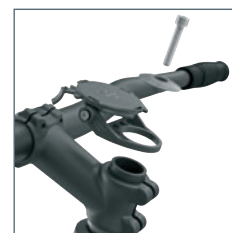
Alternatieve montage 1