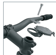
Alternatieve montage 2