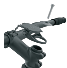
Alternatieve montage 1