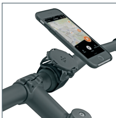
Position de montage sur le guidon