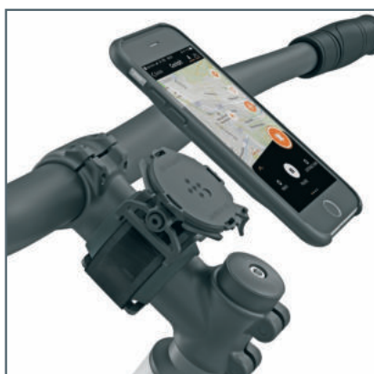
Position de montage sur la tige